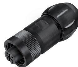
Kabeldose, Kabeldurchlass 7–17 mm