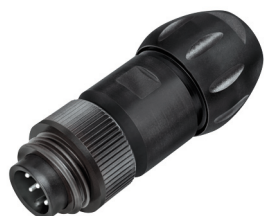
Kabelstecker, Kabeldurchlass 7–17 mm